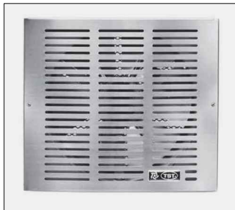
extractor para pared, de Ø 27 cm, caudal: 800 m3/h